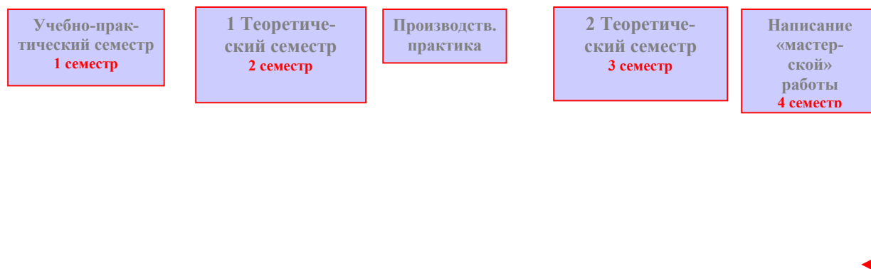
Рис. 2: Структура международной мастерской программы по специальности «Менеджмент в аграрном производстве»

Выпускники мастерской программы, показавшие наилучшие результаты в учебе, могут стать участниками программы по подготовке ассистентов, в рамках которой их готовят к участию в создании мастерской программы в их родном вузе в качестве преподавателя.